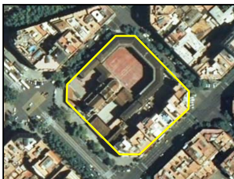
Ejemplos de Manzana .